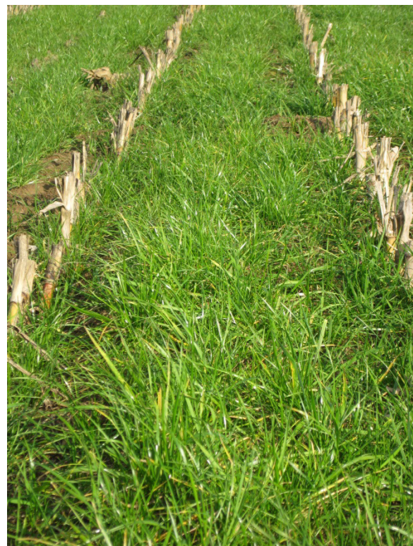
Abbildung 1: Grasuntersaat in Silomais. Nach der Silomaisenernte ist die Fläche bedeckt und vor Erosion und Nährstoffverlusten geschützt.

Wird keine mechanische Unkrautbekämpfung durchgeführt und werden Herbizide eingesetzt, muss die Pflanzenschutz-Strategie an die Untersaat angepasst werden. Je größer der zeitliche Abstand zwischen Saat und Herbizid Einsatz,